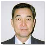
福岡県 春日西支部長