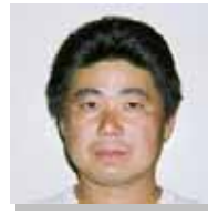
福岡県 春日西支部