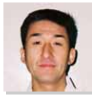
福岡県 春日西副支部長